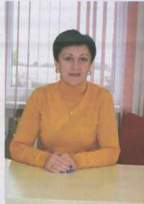
Дорогі мешканці Жашкова та передмістя!

Висловлюю вам щирою вдячність за те, що ви підтримали мене на виборах. Вже чимало років я живу та працюю в Жашкові, і тому знаю кожну вулицю та кожен двір. Більшість із них потребують оновлення та реставрації. Тому я докладатиму максимум зусиль для покращення інфраструктури Жашкова: облаштування зон відпочинку для містян, покращення стану доріг, зведення нових та ремонту вже побудованих дитячих і спортивних майданчиків тощо.