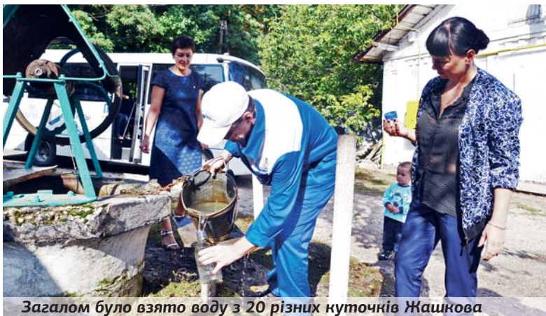
Загалом було взято воду з 20 різних куточків Жашкова

Розпочати вирішили з криниць, адже для їх перевірки у пересічного громадянина не завжди можуть знайтися кошти. До речі, дехто з жашківчан давно чекав на таку нагоду і радо запрошував експертів. Іншим вручали листи з повідомленням про наміри благодійного фонду взяти забір води саме з їхніх криниць. Для об'єктивності вирішено було дослідити