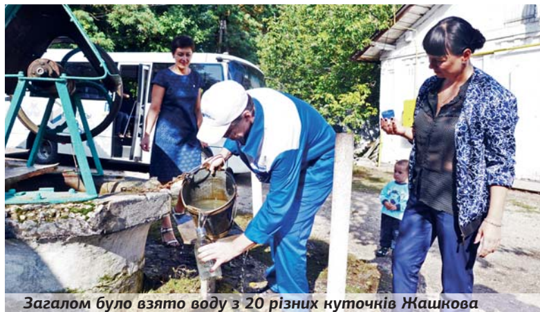
Загалом було взято воду з 20 різних куточків Жашкова

Розпочати вирішили з криниць, адже для їх перевірки у пересічного громадянина не завжди можуть знайтися кошти. До речі, дехто з жашківчан давно чекав на таку нагоду і радо запрошував експертів. Іншим вручали листи з повідомленням про наміри благодійного фонду взяти забір води саме з їхніх криниць. Для об'єктивності вирішено було дослідити