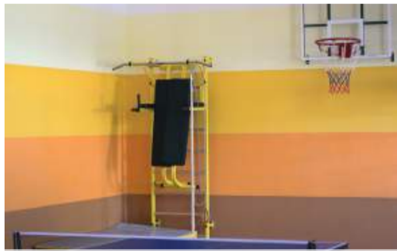
Відремонтована спортивна зала