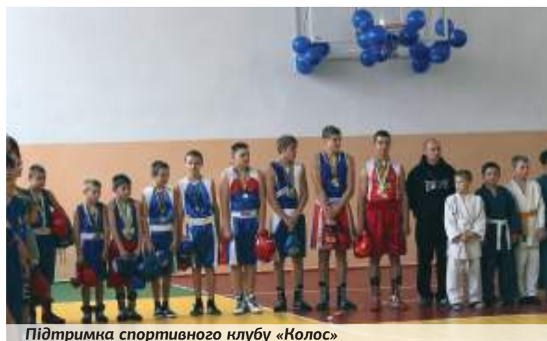
Підтримка спортивного клубу «Колос»