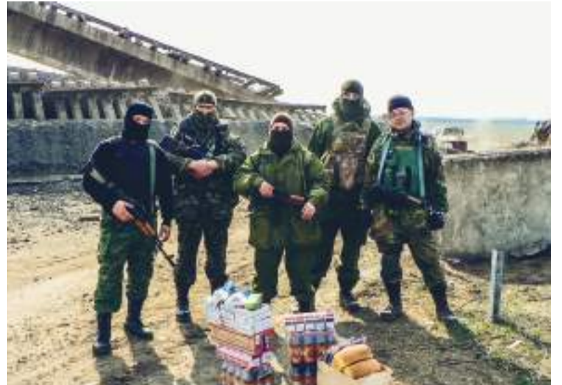
Продукція для захисників вітчизни на суму понад 230000 грн