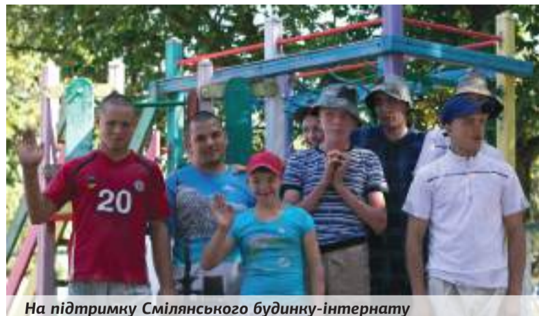
На підтримку Смілянського будинку-інтернату витрачено 2 632 000 грн