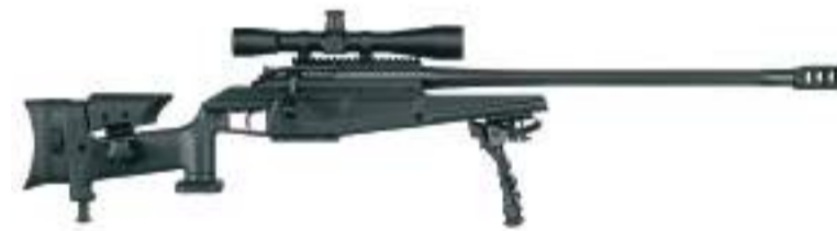
Снайперська гвинтівка калібру .338 Lapua Magnum вартістю 15 000 дол. (345 000 грн)