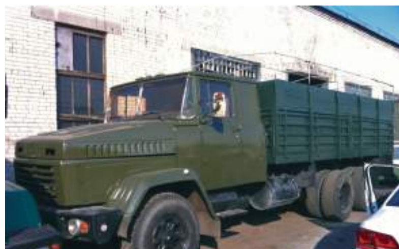
На потреби АТО передано броньований автомобіль Ford F-150, Hummer, Mercedes G500 та Краз вартістю 2 645 314 грн (за теперішнім курсом більш ніж 6 млн грн)