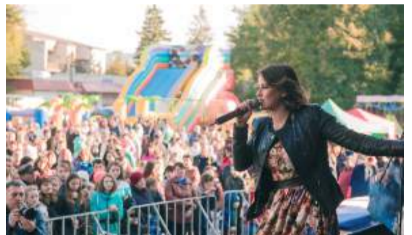
Жашківчан привітала учасниця шоу «Голос країни», колишня солістка «Віа Гри» Ірина Островська

нок і пригощали батончиками «ЕАТ МЕ» від ТОВ «Напої Плюс», молоді мамі взяли участь у параді візочків, а сімейні пари виборювали першість у конкурсах «Утримай дружину», «Любий, лови!» та звання найкращого господаря й найкращої господині. Усі переможці отримали смачні й корисні призи. На святі було ще багато різних змагань і сюрпризів,