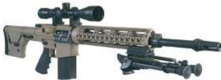
Дві гвинтівки Z10 у снайперському виконанні вартістю 10000 дол. (230 000 грн)