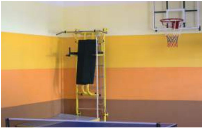
Відремонтована спортивна зала