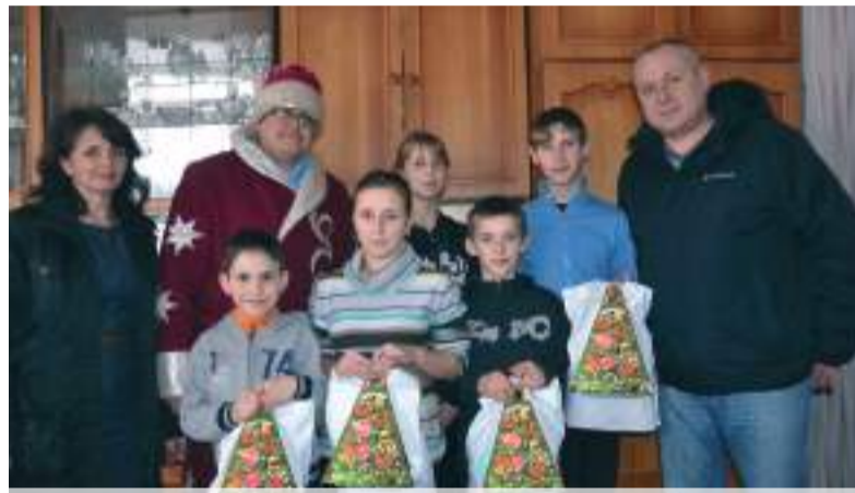
Новорічні подарунки для маленьких жашківчан

Дитсадку «Малютко» села Леміщика та жашківському дитсадку №3 «Сонечко» фонд «Нова Гро-