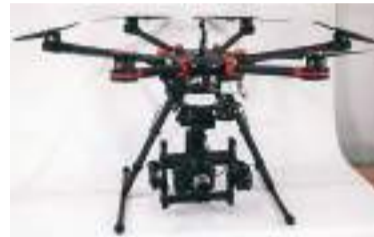
Дрон для Правого сектору вартістю 5000 дол. (115000 грн)

ліквідування інших побутових питань. Наприклад, нещодавно за рахунок нашого благодійного фонду куплено холодильник для жителя села Королівка, в якій згоріла хата. З травня фонд вже виділив понад 45 тисяч гривень на купівлю медикаментів та лікування мешканців Жашкова та Жашківського району, які особисто попросили нашу організацію про допомогу.