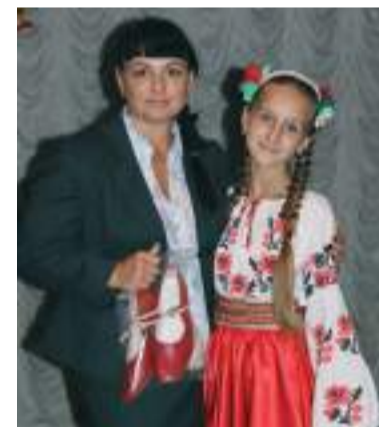
Взуття для Жашківського ансамблю танців «Веселка»

ми щороку організували свята для дітей наших працівників та з малозабезпечених родин - дарували набори солодощів та влаштовували вистави. Напередодні Нового року представники фонду «Нова Громада» завітали до 237 дітей з обмеженими можливостями віком від 1 до 16 років. А