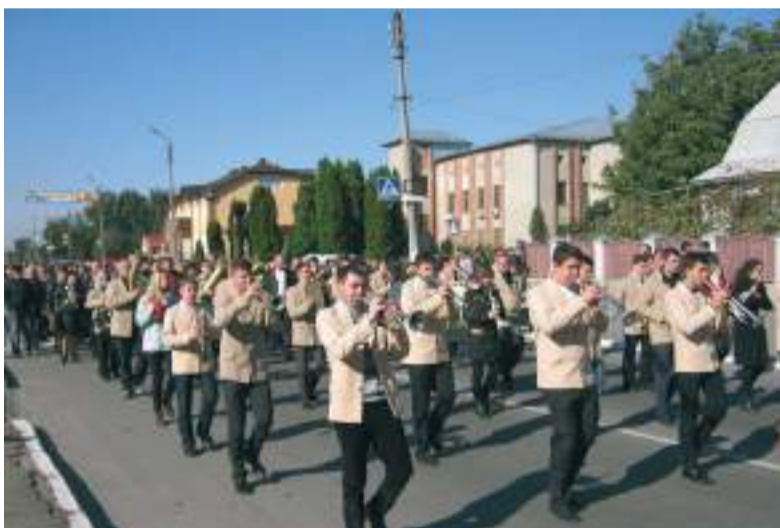
Духовий оркестр Уманського музичного училища імені Демущького