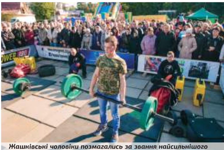
Жашківські чоловіки позмагались за звання найсильнішого