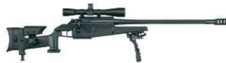
Снайперська гвинтівка калібру .338 Lapua Magnum вартістю 15 000 дол. (345 000 грн)