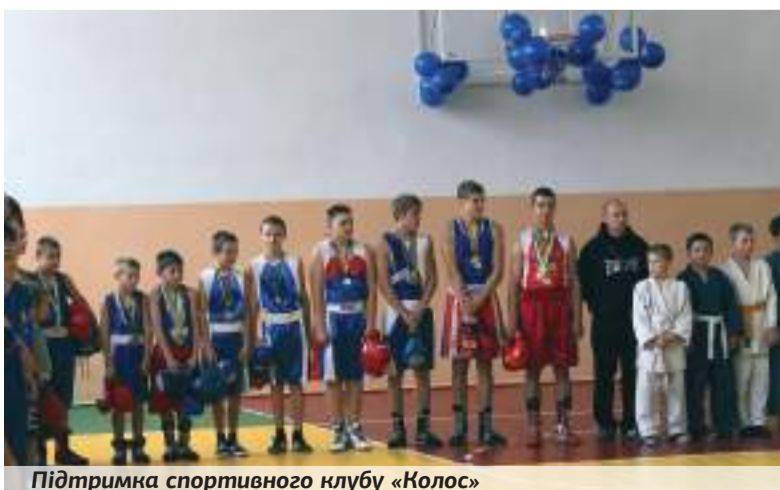
Підтримка спортивного клубу «Колос»