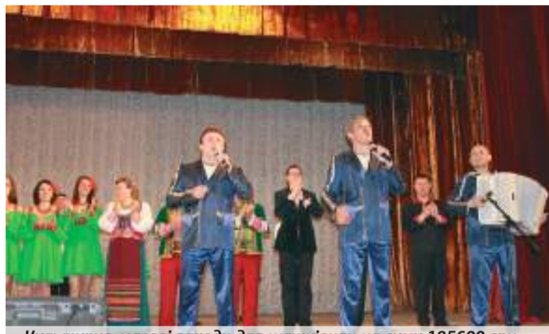
Культурно-масові заходи для жашківчан на суму 195600 грн

мада» подарував комп'ютери. А влітку до нас звернулось керівництво Жашківської ЗОШ №1, аби ми допомогли організувати екскурсію для школярів до Київського зоопарку. І ми радо їм допомогли.