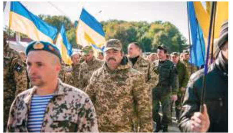
Учасників АТО нагородили орденами, медалями та нагрудними знаками «Учасник АТО»

Розвагу для себе міг вибрати кожен: чоловіки змагалися силою у «Богатирських іграх», на які приїхали відомі стронгмени, діткам у зоні аквагриму малювали веселих твари-