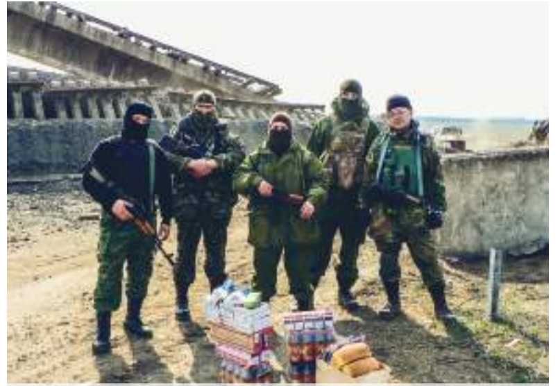
Продукція для захисників вітчизни на суму понад 230000 грн