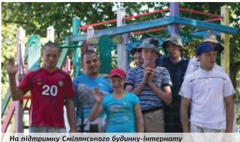
На підтримку Смілянського будинку-інтернату витрачено 2 632 000 грн