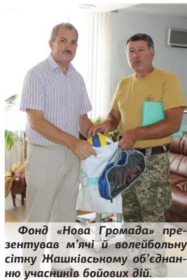
Фонд «Нова Громада» презентував м'ячі й волейбольну сітку Жашківському об'єднанню учасників бойових дій.