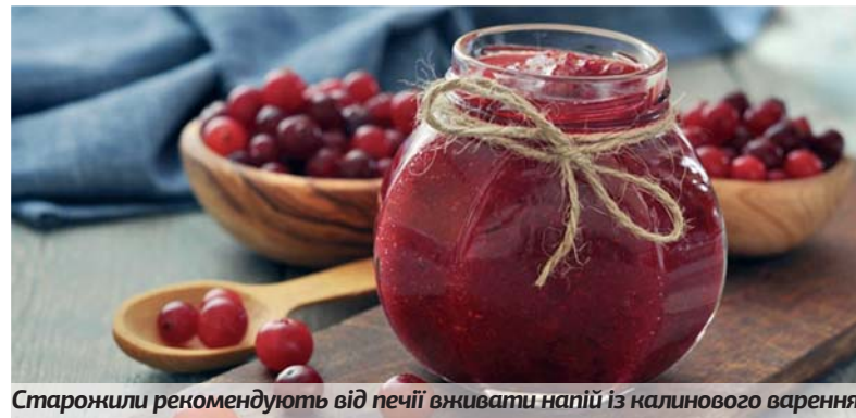
Старожили рекомендують від печії вживати напій із калинового варення

Як і ліки від печії, засоби народної медицини вважаються тимчасовими. Тому до того, як гастроентеролог визначить справжню причину виникнення цього симптому, можна скористатися одним із рецептів.