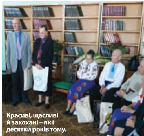
Красиві, щасливі й закохані – як і десятки років тому.