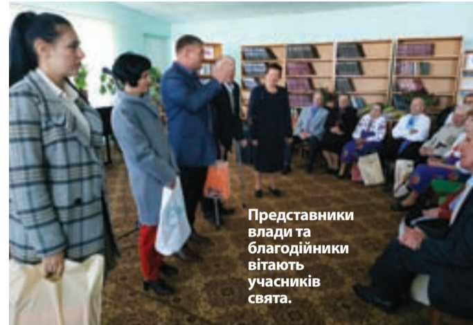
Представники влади та благодійники вітають учасників свята.