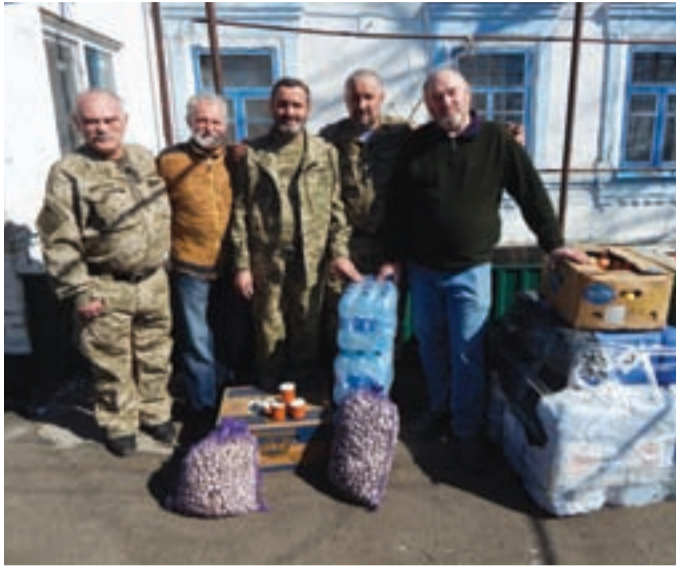
Чергова поїздка волонтерів та ветеранів бойових дій Жашківщини на схід відбулася наприкінці березня. Серед допомоги, яку земляки повезли у прифронтову зону, був і внесок БФ «Нова Громада»: 720 літрових пляшок води «Природне Джерело» виробництва ТОВ «Напої Плюс».