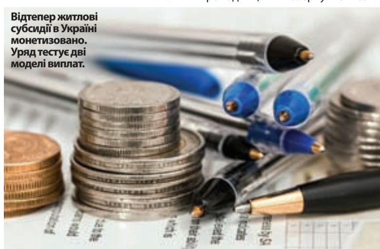
Відтепер житлові субсидії в Україні монетизовано. Уряд тестує дві моделі виплат.

У такий спосіб субсидію отримують ті українці, які звернулися за її призначенням після 1 січня 2019 року. Гроші надходять на персональні рахунки субсидіантів, відкриті в «Ощадбанку». Споживач послуг має право самостійно розпоряджатися цими коштами, однак повинен першочергово спрямовувати їх на оплату за спожиті житлово-комунальні послуги. У «платіжках» не вказується розмір субсидії, і людина має сплачувати всю суму, вказану надавачем послуг. Знову таки важлива інформація про заборгованість: якщо в кінці опалювального сезону вона перевищила 340 гривень, субсидії на наступний сезон не буде.