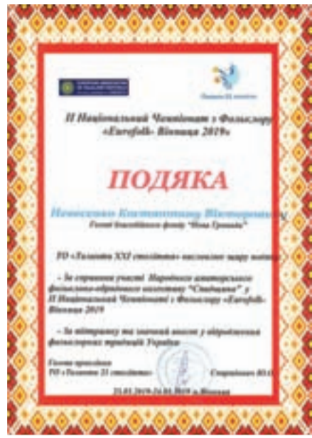
Участь артистів у чемпіонаті підтримав БФ «Нова Громада».