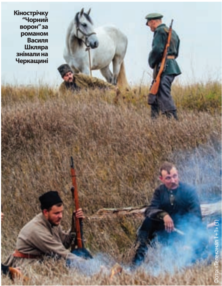
Кінострічку «Чорний ворон» за романом Василя Шкляра знімали на Черкащині

Зараз краєвиди Черкащини з'являються у сучасному українському кіно. У 2018 році на екрани вийшла