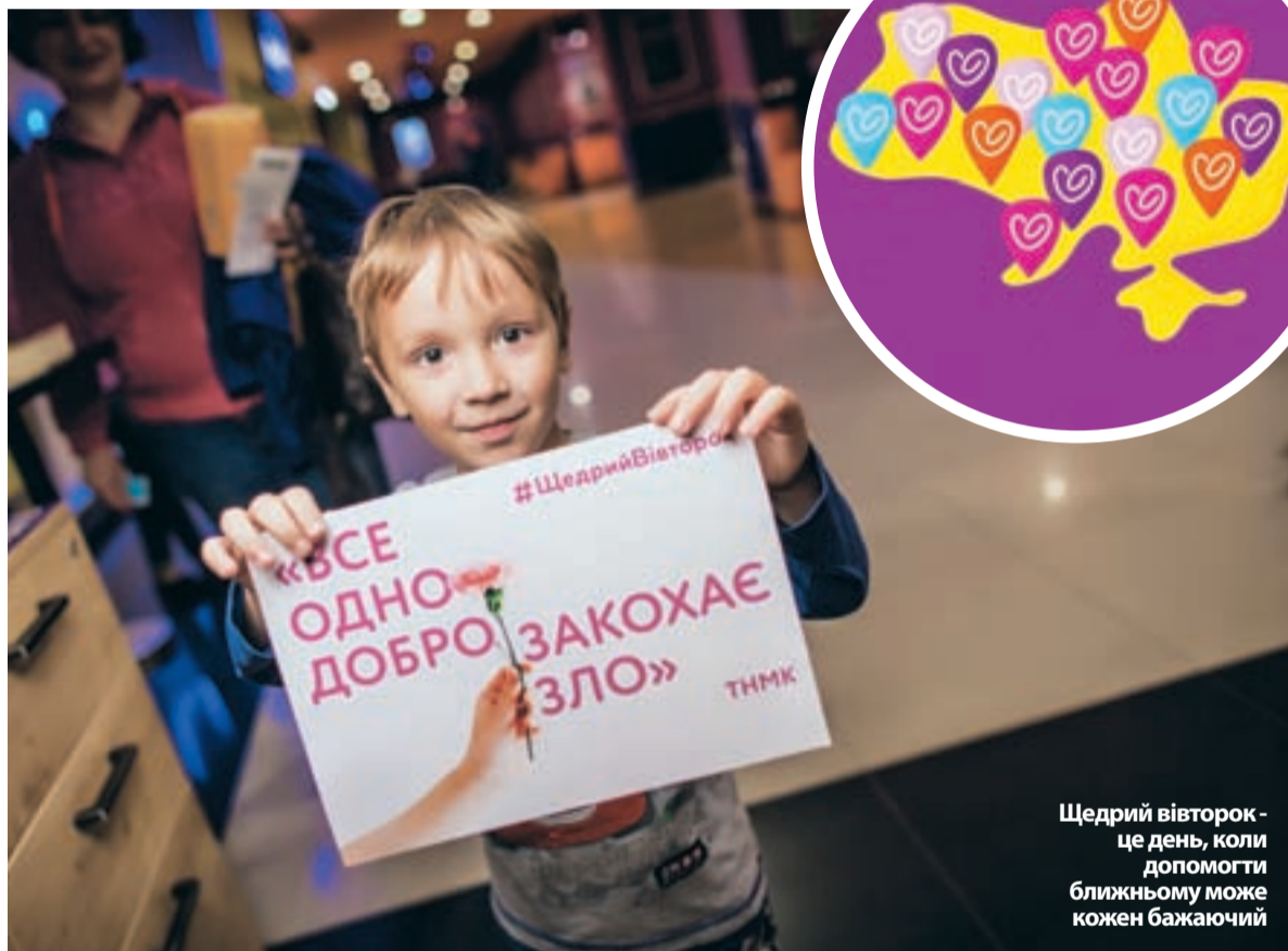
Щедрий вівторок - це день, коли допомогти ближньому може кожен бажаючий

Отже, учасником «Щедрого вівторка» може стати будь-який українець. Головне – творити добро та навчати цьому інших.