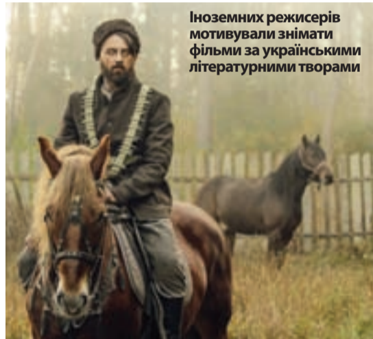
Іноземні режисери мотивували знімати фільми за українськими літературними творами

Цілком ймовірно, що вже скоро подібні фільми будуть знімати американські та європейські режисери. Адже закон обіцяє кіношникам додаткові 5% відшкодування, якщо їх кінострічка базується на українському літературному творі.